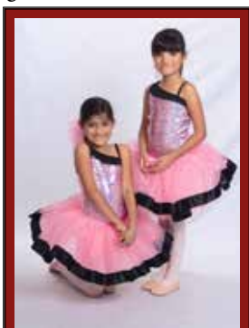
rosa Schwestern :-)

Allerdings: So schön das gelegentlich ist – auf Dauer ist das natürlich zu wenig. Eine Freundin, die immer nur zum Einschlafen zu mir kommt, und mich – wenn auch mit liebevollen Blick – anschließend immer wortlos verlässt, ist auf Dauer schon eine seltsame Freundin. Zu einer echten Freundschaft gehört natürlich auch die verbale Kommunikation. Bevor ich allerdings davon rede, eine wichtige Frage: